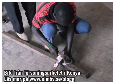
Bild från försoningsarbetet i Kenya. Läs mer på www.elmbv.se/blogg